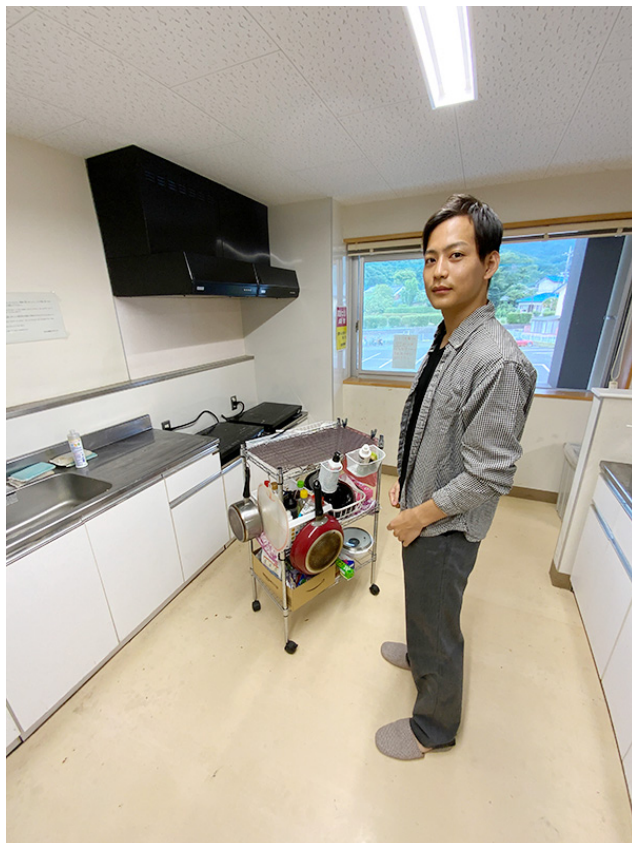
共用キッチンへは料理道具一式をワゴンで持参！